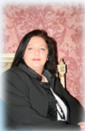
Sonia Scopelliti (Presidente del Congresso)